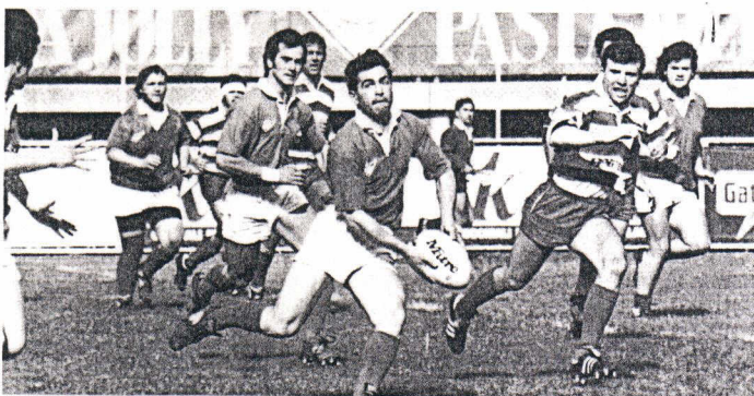
La Pasta Jolly di Ino Pizzolato resta in serie A1.

E dire che questa squadra viene da una storia di campionato travagliata e difficile, non solo per la lunga indisponibilità del XV migliore, ma anche per alcune defaillance che hanno rischiato di comprometterne la linea di galleggiamento. Probabilmente il punto più