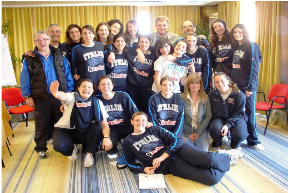
Nazionale giovanile di pallacanestro

Soprattutto, per mantenere la mente calma e posata è importante imparare a non giudicare e criticare, né quello che stiamo facendo né quello che stanno facendo gli altri; per la calma mentale, la critica continua e ossessiva, costantemente negativa, finisce per essere come quello che sta pedalando sulla bicicletta al massimo dello sforzo, che sta approfondendo tutto il suo impegno e la sua dedizione, ma che nello stesso tempo tiene i freni della bicicletta ben tirati: fatica tanta, risultati pochi e soddisfazione inesistente (tranne, naturalmente, ... per i masochisti).