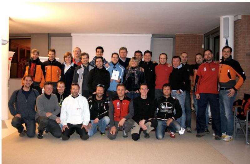
A.S. Team Montegrappa - Parapendio